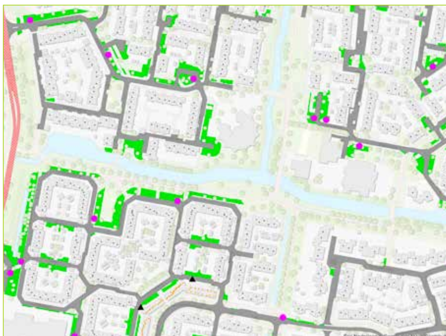
Afbeelding 1. Groene vlakken geven de beschikbare ruimte weer na het verwerken van de locatiecriteria. Paarse stippen zijn de overwogen locaties en zwarte driehoeken de bestaande containers. De kleine stipjes geven de huisaansluitingen weer.

Maar hoe leg je vervolgens de locatiekeuze voor aan ruim 11.000 huishoudens? De gemeente Leusden ziet dit als een kaartspel, waarbij je de kaarten van de gemeente niet voor jezelf houdt, maar open op tafel legt. Door je in je kaarten te laten kijken, maak je bewoners onderdeel van je complexe vraagstuk om geschikte containerlocaties te vinden. Doel is het creëren van draagvlak en begrip vooraf en het voorkomen van eindeloze juridische procedures en vertraging tijdens de uitvoering. Leusden legde de voorlopige plannen al in een vroeg stadium voor aan alle bewoners. Dit was nodig om de voorkeurslocaties van bewoners te kunnen verwerken in het ontwerp locatieplan. Daarnaast kon de gemeente alle bezwaren, vragen en suggesties al verwerken, nog vóór de formele inspraak- en besluitvormingsprocedure. In dit proces is het belangrijk dat je als gemeente duidelijk bent richting bewoners over wat er te kiezen valt binnen de randvoorwaarden